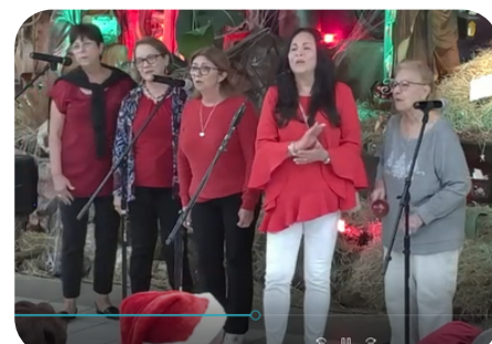
Grupos Camino de Esperanza, Lazos de Amor, Radio y Tv, Desarrollo y Ntra. Sra. de la Escribanía en plena actuación en la Cantata Navideña II edición.