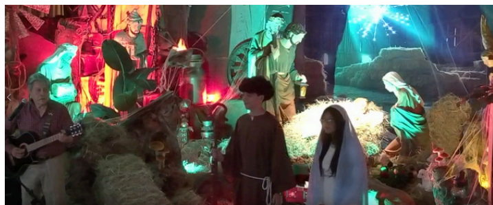
Finalmente, todos unidos interpretando Noche de Paz con la presencia de los jóvenes personificando a José y María.