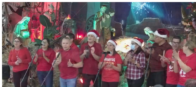
El grupo La sagrada Familia en su turno muy concentrados.