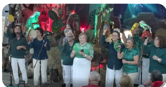
Muy alegres en su participacion los grupos Liturgia y Rosario San Jose.